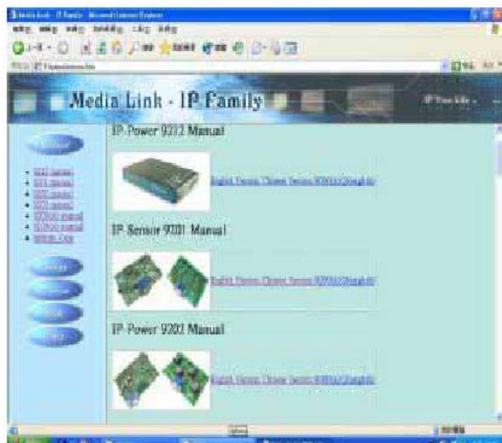
Image 2 : segment 192.168.1.XXX